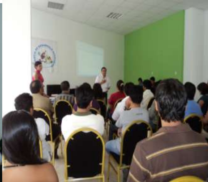
EVALUACIONES DE AÑOS ANTERIORES DE SEMANA SANTA