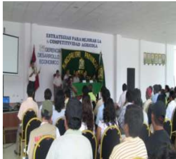
PARTICIPACION MASIVA DE LOS PRODUCTORES