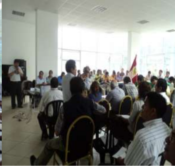
PROBLEMÁTICA DE LA CAFICULTURA