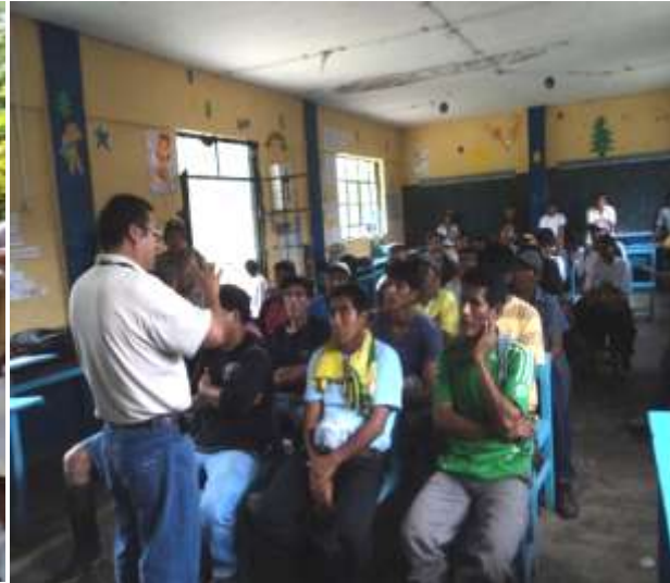
PRODUCTORES DE RIO DOLORES