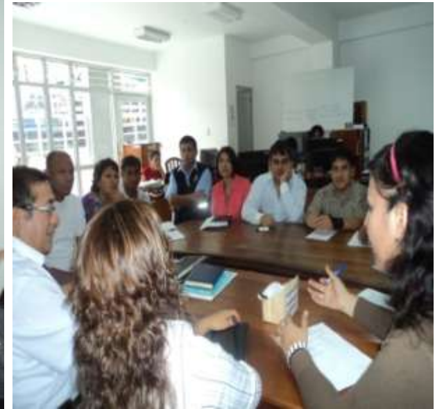
REUNION DE TRABAJO CON GERENTES DE FECHA 15-02-11