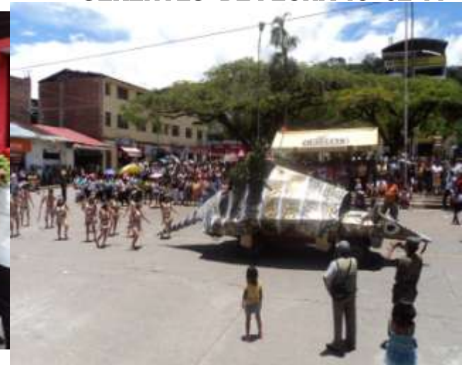
LA GRAN CARABANA DEL I CARNAVAL