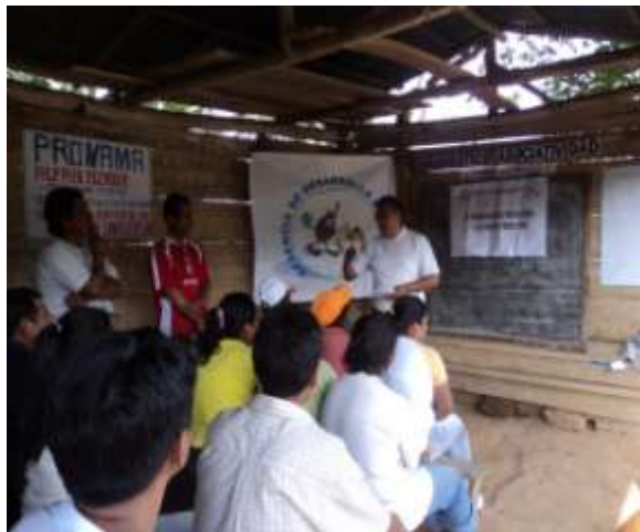
PRODUCTORES DE ALTO UNIVERSAL