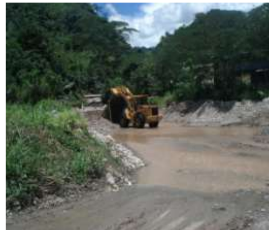
CANTERA DE RIO BLANCO