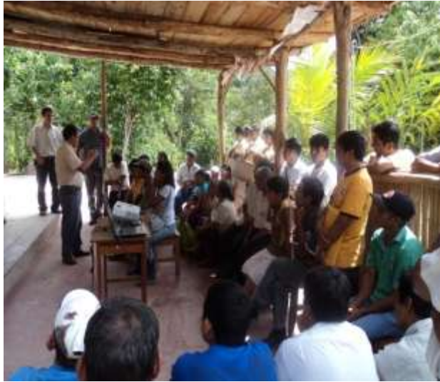
PRODUCTORES DE PUBLLO PARDO