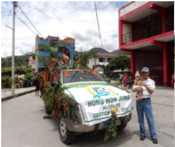
HUNG WON JUNG PROMUEVE EL I CARNAVAL