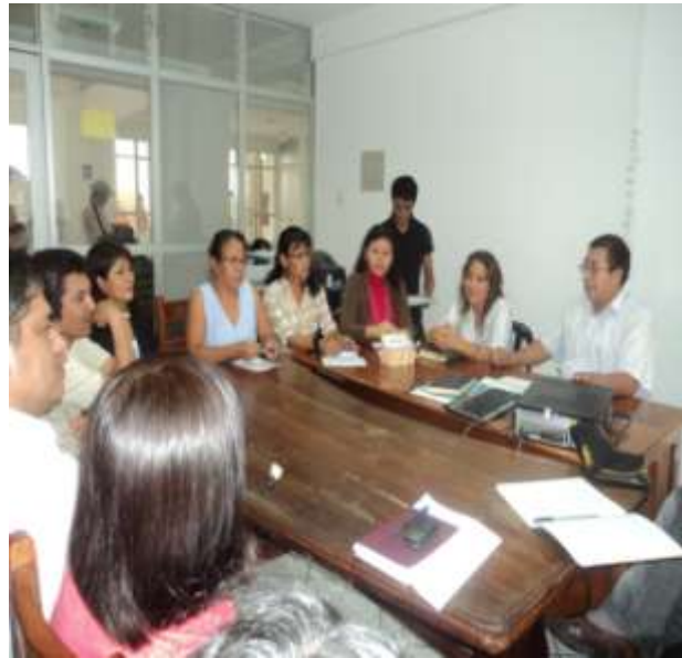
REUNION DE TRABAJO CON GERENTES DE FECHA 09-02-11