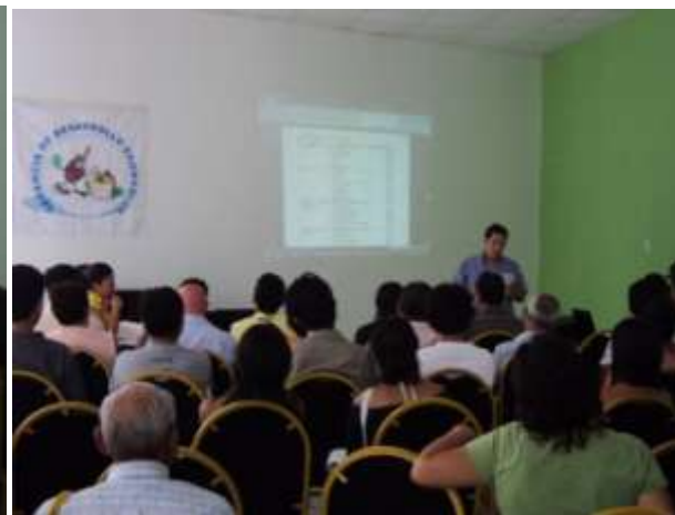
SUB COMICIONES PRESENTAN SUS PLANES DE TRABAJO