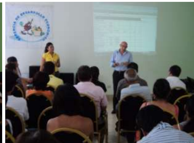
CONSOLIDANDO EL PROGRAMA POR SEMANA SANTA