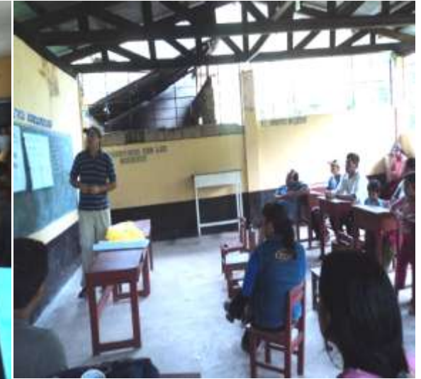
PRODUCTORES DE LA RUMILDA