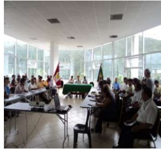
PARTICIPACION DE LA JNC