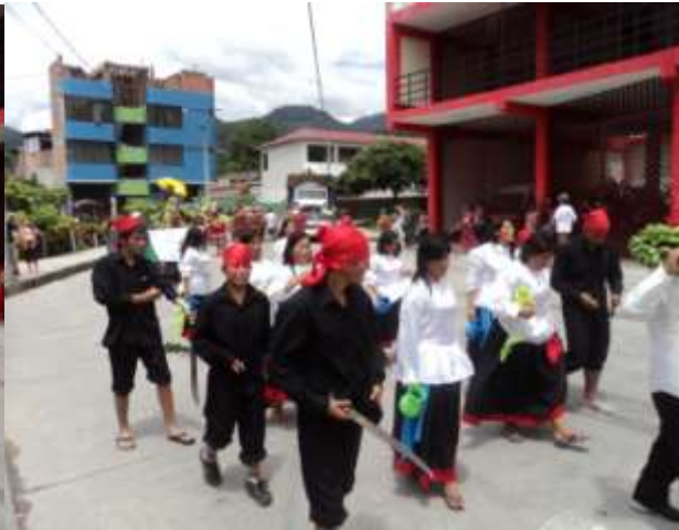
ELENCO DE DANZA DE LA MPCH