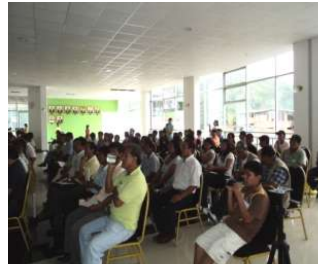
PMEDIOS DE COMUNICACIÓN PARTICIPAN EN TRABAJO CON PRODUCTORES