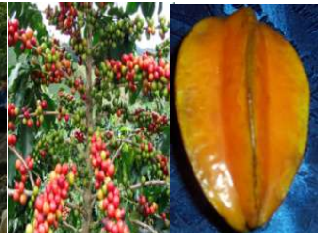
PRODUCTOS DE LA ZONA