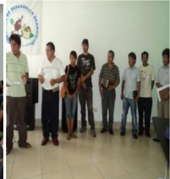
CONFORMACION DEL COMITÉ ORGANIZADOR DE SEMANA SANTA