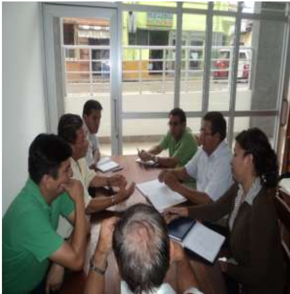
COMITÉ ORGANIZADOR DEL I CARNAVAL DE LA SELVA CENTRAL