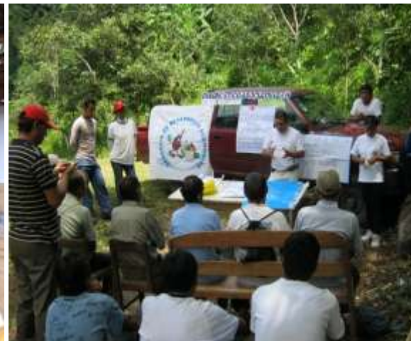
PRODUCTORES DE SANTO DOMINGO